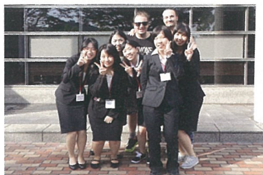
上演前に記念写真