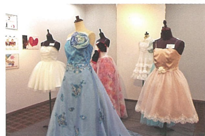
展示されたウエディングドレス

「ブルーム(BLOOM)展」の名前には、蕾のような学生たちが一般社会へと旅立ち大輪の花を咲かせるように、との願いもこめられています。学生たちが学んできた集大成といえる作品展は、今年度も開催予定です。