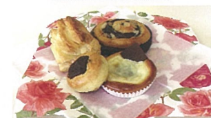
フェアトレードのチョコレートを使ったパン 後列右から時計回りにマーブルパン、 クリームチーズのタルト風パン、スコーン、パイ