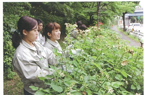
花から摘みを行う学生

本活動は、須磨離宮公園において、学生が継続的にバラの手入れや園内ガイドを経験し、バラに関する知識を深め、技術を習得するとともに、地域住民と学生との交流をはかることを目的としています。平成27年度は、8名の学生が参加しており、同園職員の協力で週1回の活動を行っています。本活動のスタートから、学生は園内のバラを観察し、秋には本学オリジナルの「ローズ・カタログ」を作成しました。須磨離宮公園がもつ豊かな自然空間・文化資源を生かした本活動は、参加している学生からの評価も高く、楽しみながら活動している様子がうかがえます。