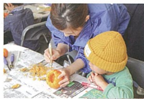
キャンドルナイトのボランティア

秋のローズフェスティバルの一環として開催される「ローズキャンドルナイト」も神戸女子大学の学生が運営を支えます。「ハロウィンフェスティバル」がテーマで、「神戸キャンドルナイト実行委員会ホウキ星」のスタッフと協力しキャンドルの準備や点灯などを行い、イベントの受付、子どもたちのかぼちゃランタンやオリジナルキャンドルホルダー作りの補助をします。平成27年は15名の学生が参加しました。