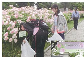
須磨音楽の森でのボランティア

神戸女子大学は、二つの寮(行幸寮、天神寮)の学生が中心になって、受付・案内、運営補助、清掃活動の協力を例年行っています。平成27年には34名の寮生が参加しました。