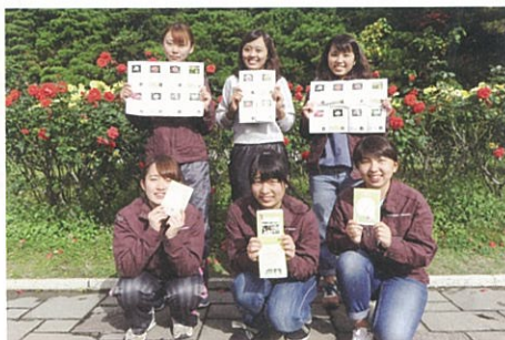
神戸女子大学オリジナル「ローズ・カタログ」を手にする学生