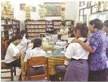
女子高生の貧血健診

2013年8月23日から9日間、健康福祉学部 健康スポーツ栄養学科3年生4名と4年生3名、社会福祉学科2年生2名の合計9名がインドネシア共和国バリ州(バリ島)において実施された国際健康福祉プログラムⅠに参加し、現地の医療・栄養の現状を学び、文化に触れインドネシア国立ウダヤナ大学医学部在学学生との交流も深めました。