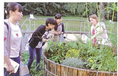
ハーブの効用の説明(ハーブ菜園にて)