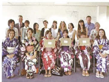
修了式でケント大学の先生方とともに記念撮影

ケント大学は、本学園と1993年に姉妹校提携協定を結び、ハワイ大学に次ぐ国際交流の実績があります。今回の語学研修(2013年8月3日から3週間)は、20回目の実施となり、13名の学生が参加しました。この研修は、英語力の向上とイギリスの文化及び歴史の学習、そしてプレゼンテーション力の強化を目的としています。