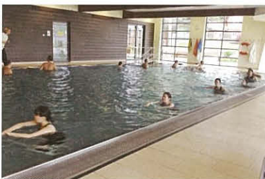
運動療法(アクアエクササイズ)