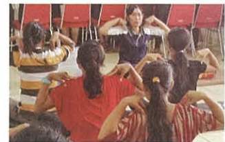
妊婦体操教室(バリ第4保健所)

学生たちは、急激な発展途上にあり栄養摂取の過剰と不足という健康問題の二極化に直面するインドネシア・バリ島の現状を学ぶため地域の保健所、病院、各福祉施設などでフィールドワークを行い理解を深めました。民家も訪れ、伝統を大切にしている大家族で暮らしている現地の人々の生活を見て現状を知るとともに、インドネシアの人々のおだやかな人柄に触れ、学んでいる専門的知識を深めて人々の役に立ちたいという気持ちが強くなりました。また、国際的なコミュニケーション能力の向上を目指す意欲が沸きました。