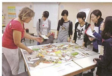
ホーエン・フロイデンシュタット病院の栄養士による栄養指導の説明