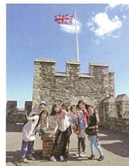
観光で訪れたドーバー城

短期間の研修とはいえ、参加学生からは、「英語のコミュニケーション力が向上した」「異文化理解が深まった」といったコメントが多く聞かれ、研修の成果を実感していました。