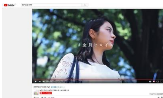
(神戸女子大学PV #全員ヒロイン)

7/16 (月) PI キャンパス、10/8 (月) 須磨キャンパス、11/23 (月) PI キャンパスで実施し、参加者は前年度より 67 名増の 192 名になり、高校 3 年生の出願率は、約 9 割に達した。