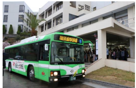
（須磨キャンパス内から発車する神戸市バス）