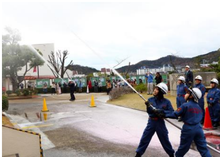
(防火・防災訓練で活躍する学生消防団)