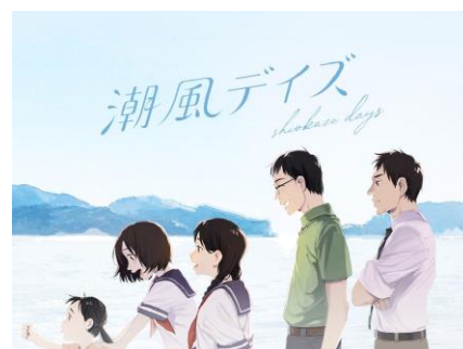
(栄養学特集マンガ 潮風デイズ)