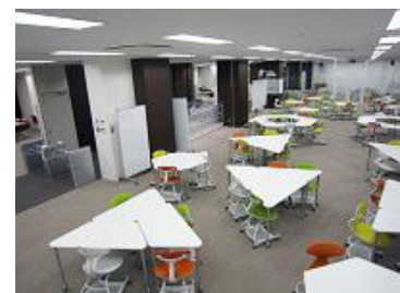
(開館時間を延長したポートアイランドキャンパス図書館)

ポートアイランドキャンパスでは、平成 30 年度より、図書館の開館時間を須磨キャンパス図書館に合わせて延長した。また、授業や試験、国家試験受験対策等に意欲的に取り組む学生への支援を目的として、平成 29 年度後期から図書館及び体育施設を除く教室等の施設利用時間の拡大を図るとともに、学生の安全確保のための管理体制を整備した。