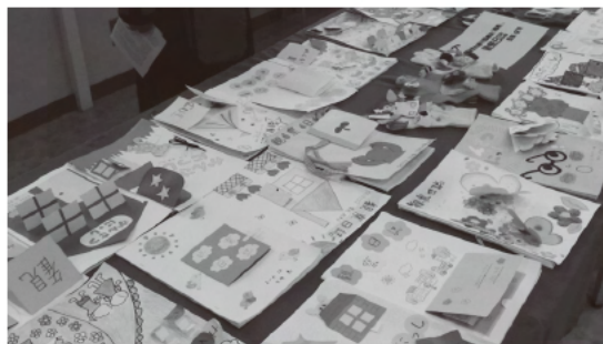
写真8 観察記録（第3回より）