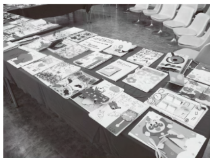
写真7 観察記録（第2回より）

保育者は、心を外に向けることが必要である。子どもをよく見る、友達の間を見てとらえる、保護者の様子や表情を瞬時に感じ取る、教師間の関係をよくするなどである。子どもたちの様子や周りの環境、身近な自然の様子をいち早く見て感じ取り、また深く観察することで、「保育の芽」を見つけるのである。保育者の資質として、周りをよく見て気を配るということを習慣付けていくことが大切である。