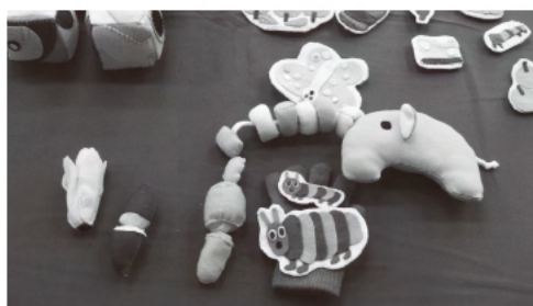
写真9 おもちゃ①（第3回より）

1歳頃のものを投げる行為に関していえば、「ものを投げはダメ」というだけでなく、保育者として子どもの姿を「腕や足が発達してきているために粗大な動きを欲している」と捉えることもできる。子どもは身近な環境に自らかかわり、発見を楽しんだり考えたりしながら、それを生活に取り入れようとする。こうした子どもの姿をよくみて、支援のための適切な環境を作ることにこそ、保育者の専門性が試される。保育は、子どもの生活や遊びを通して、その内容が互に関連しながら総合的に展開されるものである。そのために、身体運動の発達を豊かに展開し得る保育の長期的・短期的な保育計画が必要となる。