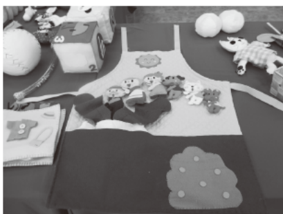
写真5 エプロンシアター(第2回より)

子どもの反応を想像しながら題材を決め、エプロンや手袋の色を選び、部品の色、表情においても、伝えたいことが子どもに伝わるだろうか?などと試行錯誤する。その過程を通して、表現の面白さに気づき、楽しさも感じるようになる。そうしてできた愛着ある教材を使って子どもの前で実演し、子どもの笑顔を見ると、その達成感は充実した喜びとなる。保育者になろうという意欲を高めるには、このような「子どもたちに心が伝わる」という経験の積み重ねが必要なのである。学生たちは、そのようにして「保育の心」を感じ取っていくのである。