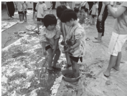
写真3 制作している子どもの様子(第2回より)