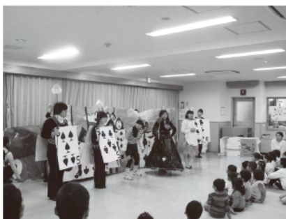
写真1 劇上演の様子①（第2回より）

毎年、学生は11月に行われる学園祭において、「幼教パフォーマンス」という幼児教育学科の学生がクラスごとに子ども向けの劇やオペレッタを発表している。その中で、神女中山手保育園の園児や地域の親子たちの前で発表する上で最も適していると思われる2年生のクラスに、「きずな DAY 賞」（幼児教育学科教員全員で選考）が贈られ、そのクラスが、きずな DAY 当日に上演することとなる。「きずな DAY」当日の劇は、幼教パフォーマンスの再演ではなく、保育園の子どもに見せるに相応しいアレンジが求められている。保育者を目指す学生にとって劇を発表することは、表現技術を磨くことのできる貴重な機会となっている。