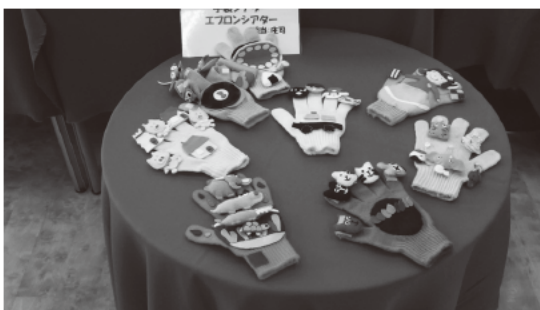
写真6 手袋シアター(第3回より)