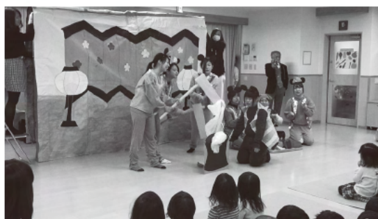
写真2 劇上演の様子②（第3回より）