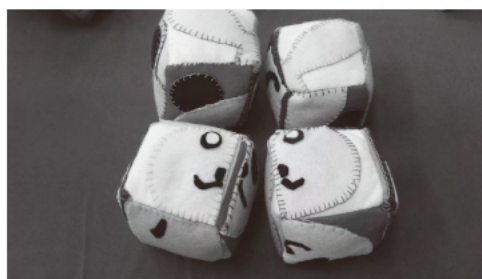
写真10 おもちゃ②（第3回より）