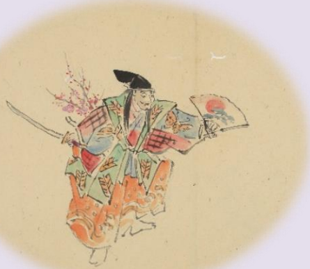
『能狂言画帖』「箆」(吉田文庫蔵)