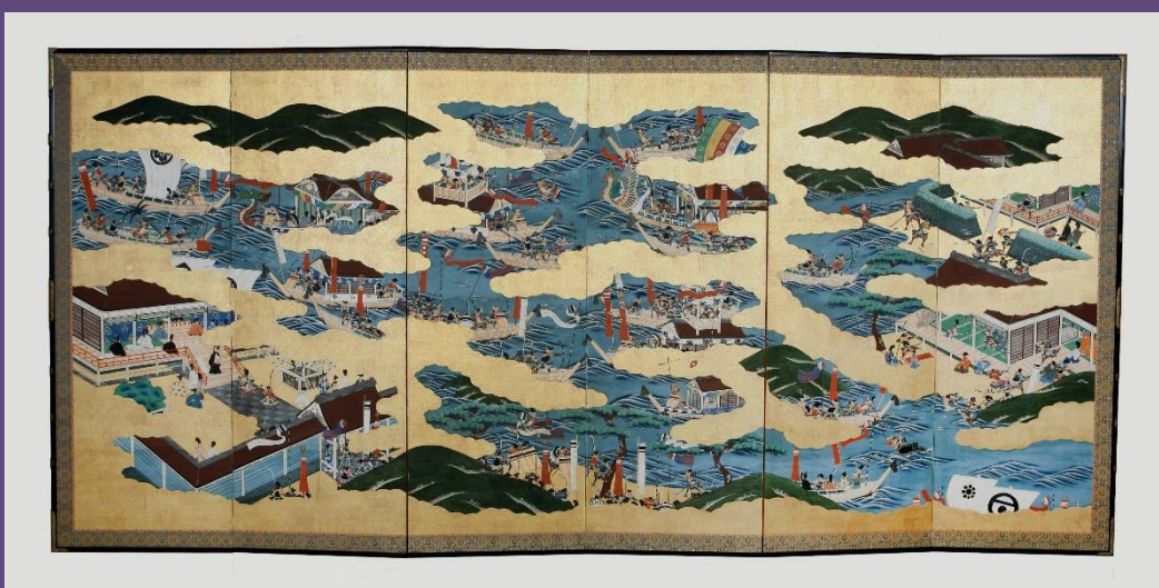
生田神社蔵「源平合戦屏風」(上：右雙、下：左雙)