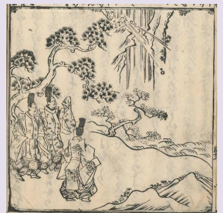
『伊勢物語』八十七段挿絵(布引瀧) (志水文庫蔵)